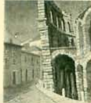
アレーナ(ローマ・イタリア)

9:19(木)~24(火) AM11:00~PM7:00 (最終日5:00迄) TEL:06-6211-7787 会場:G11上野さんのホームページをご覧ください http://www.nobuyuki.jp.com